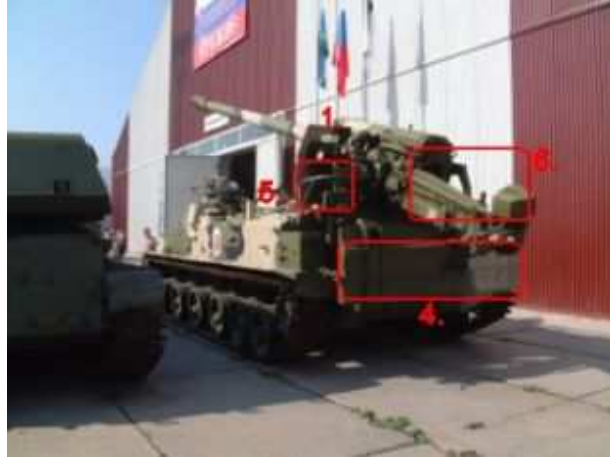
ALGERIAKAMOV 50 هذه بعض الصور للأجزاء الأساسية الخارجية. 30-07-2009